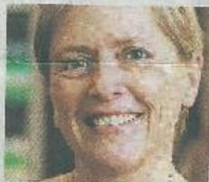
„Manchmal glaubt man, Vereine seien hauptsächlich hauptsächlich zwischen 11 und 13 Uhr tätig.“

Dem widerspricht Susanne Eisenmann. 85 Prozent der Eltern würden die Einführung des Ganztagsangebots an Grundschulen begrüßen. Außerdem gebe es auch künftig eine gewisse Wahlmöglichkeit für Eltern, da nicht alle Schulen zu Ganztagschulen würden. 17 Schulen der Stadt hätten bereits ein Ganztagsangebot, die Erfahrungen dort seien durchweg positiv, sagt Eisenmann. Sie hat für den aufkeimenden Protest nur wenig Verständnis: „Manchmal glaubt man, die Vereine seien heute hauptsächlich zwischen 11 und 13 Uhr tätig.“